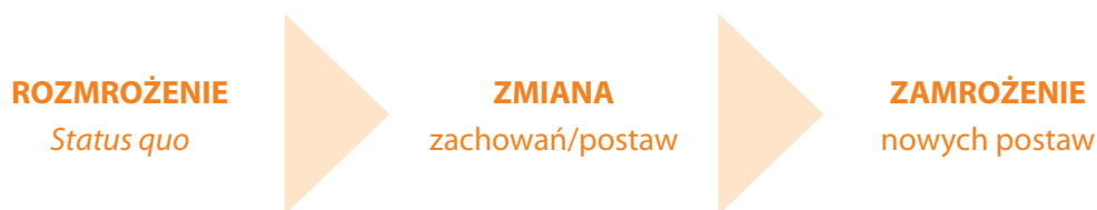
Schemat 2. Model przebiegu wdrażania zmiany (wg K. Lewina)